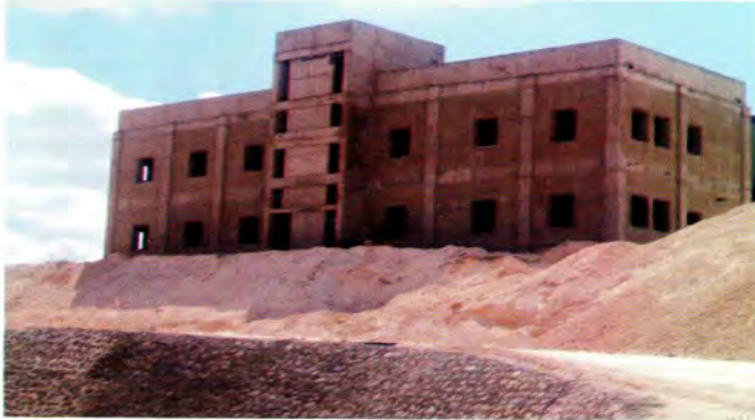
مبنى الادارة في محطة توليد السمرا

لقد عملت شركة السمرا مع مستشارها الفني الحالي السادة شركة كولجيان الامريكية على إعداد مواصفات العطاء في الربع الأخير من عام 2005، وتم طرح العطاء بتاريخ 2006/01/02 و تم تحديد موعد استلام العروض في نهاية آذار 2006 وستقوم شركة السمرا بتمويل هذه الوحدة من خلال المصادر الذاتية والاقتراض المحلي.