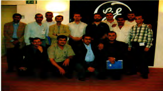
التدريب في شركة جنرال إلكتريك الصانعة

حرصت إدارة شركة السمرا على تأهيل ورفع كفاءة موظفيها من خلال تضمين العقد المبرم مع المقاول المنفذ لمشروع محطة التوليد على بند خاص بتدريب عدد من موظفي الشركة ( مهندسين ومراقبين وفنيين ) على المعدات والآلات الأساسية قبل البدء بتشغيل الوحدات، وتم عمل برامج تدريبية خاصة في مراكز تدريب الشركات الموردة للأنظمة كما تم تنفيذ برامج تدريب نظرية وعملية في الموقع شملت عدداً كبيراً من العاملين في الصيانة والتشغيل لوحدات التوليد. إضافة إلى ذلك، فقد تم إيفاد 28 موظف ما بين مهندس وفني لحضور الفحوصات المصنعية لأغلب المعدات خارج الأردن للتأكد من جودة التصنيع ولزيادة الفائدة والمعرفة لكادر الشركة. أما بخصوص التعاون مع مراكز التدريب والتأهيل والمؤسسات العلمية فقد شاركت الشركة بالعديد من الدورات التدريبية والدورات العلمية حيث كان المردود لمشاركة عدد كبير من موظفي الشركة على مختلف تخصصاتهم في هذه الفعاليات إيجابياً من الناحية العلمية والعملية في شتى المجالات.