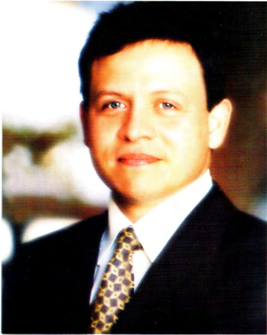
حضرة صاحب الجلالة الملك عبد الله الثاني بن الحسين المعظم