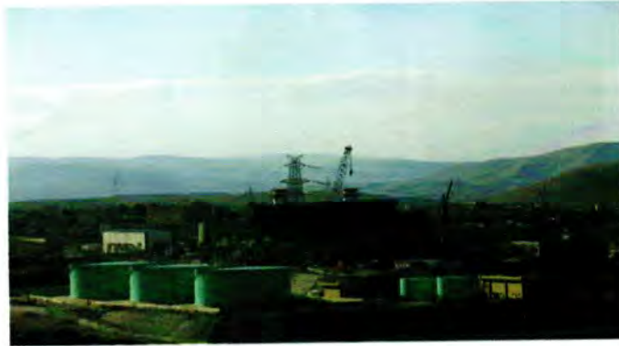
محطة السمرا لتوليد الكهرباء