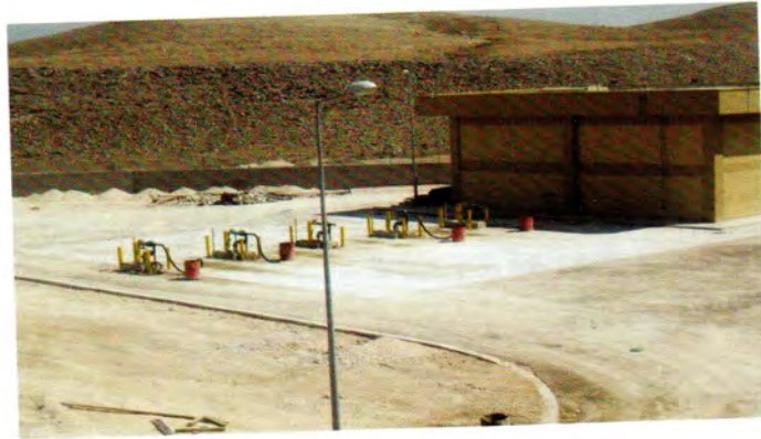
منطقة التفريغ لوقود الديزل