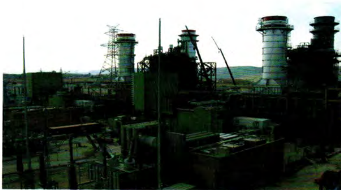
منظر جانبي للوحدتين الغازيتين