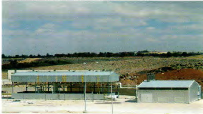
محطة تخفيض الضغط للغاز الطبيعي

بما أن وحدات التوليد في شركة السمرا مصممة لتعمل على حرق الغاز الطبيعي كوقود أساسي والديزل كوقود بديل، كان من الضروري العمل على تجهيز أنظمة استقبال وتجهيز وقود الغاز لمحطة السمرا بحيث تكون جاهزة للعمل مع نهاية عام 2005 بدلاً من منتصف عام 2006 بسبب التسارع الذي تم على تنفيذ مشروع خط الغاز المصري الأردني. وعليه تم الاتفاق مع المقاول شركة (بلاك أند فيتس الأمريكية بالإتلاف مع شركة جاما التركية) لتوريد وتركيب نظام غاز جديد حسب المواصفات العالمية، و قد اكتمل العمل في هذا النظام مع نهاية عام 2005 وهو الموعد الذي حدد لوصول الغاز للمحطة، وعلى الرغم من أنه قد ترتب على ذلك كلفة إضافية على قيمة المشروع إلا أن المردود المادي الكبير العائد على الشركة خصوصاً والبلد عموماً نتيجة حرق الغاز الطبيعي بدلاً من مادة الديزل المرتفعة الكلفة لا يقارن بالكلفة الإضافية لنظام الغاز الجديد.