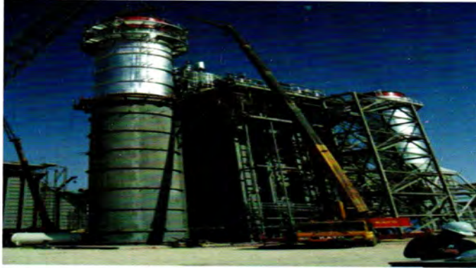
منظر جانبي للمبادل الحراري