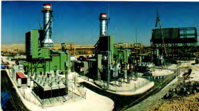
منظر عام للوحدات الغازية

وللشركة طموحات مستقبلية لاستكمال بناء مشروع المحطة والاستمرار في التوسع في هذا الموقع ليكون من أهم مراكز توليد الكهرباء في المملكة مستعينة بالخبرات المحلية والعالمية.