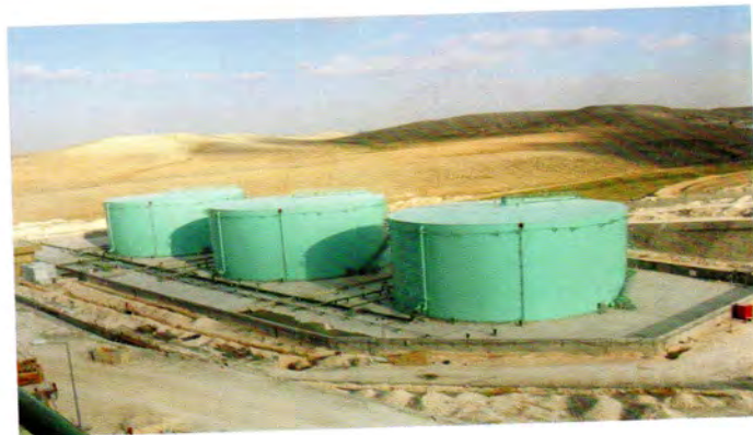
خزانات الديزل (10.000 م 3 سعة كل منها )